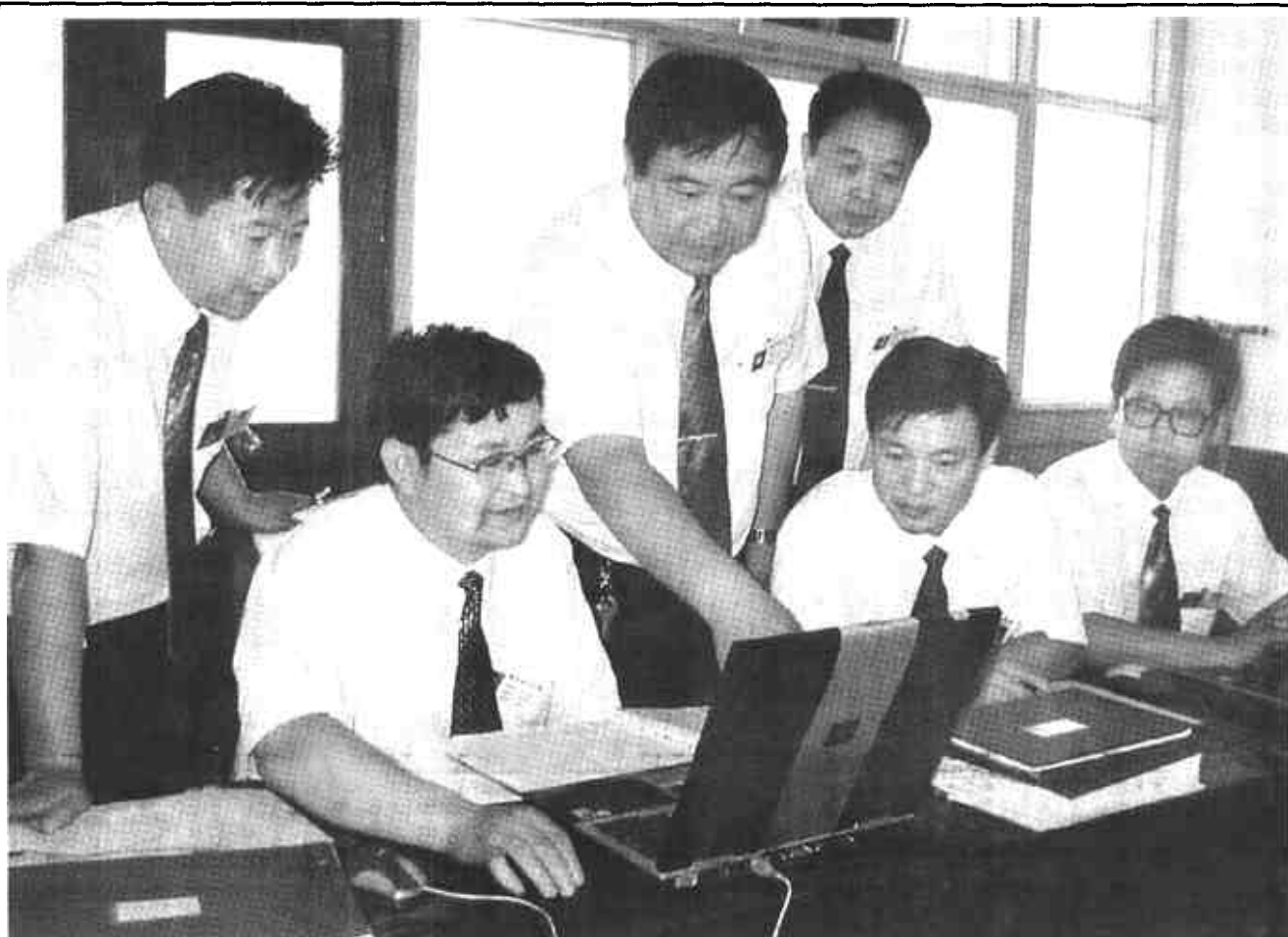
垦利县审计局按照“全面审计，突出重点”的要求，坚持依法从审，规范审计行为，不断提高审计工作质量，努力推进审计队伍“人、法、技”建设。

河口讯 近年来，河口区和镇把发展高新技术和运用高新技术改造传统产业作为发展经济的重要手段。