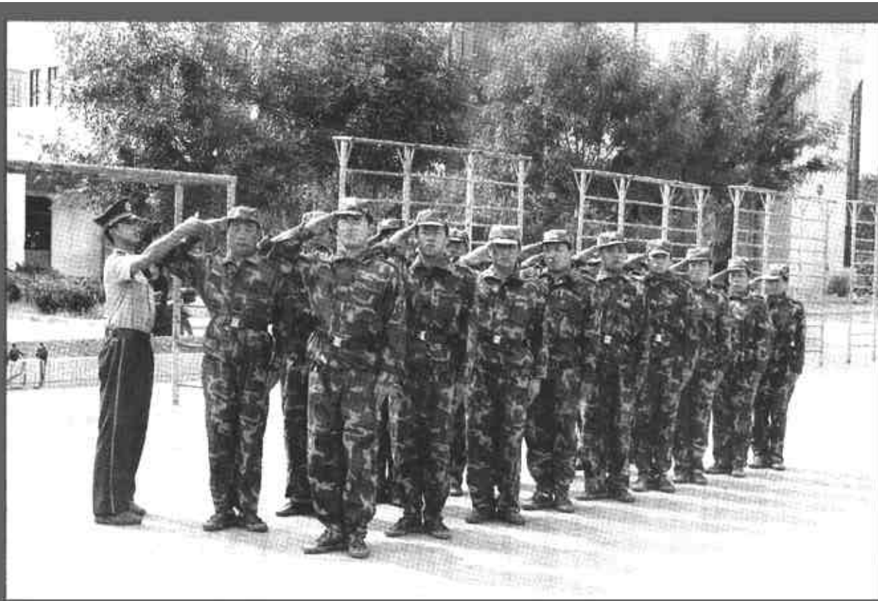
日前,市质量技术监督局为提高行政执法队伍的整体素质,树立质监部门新形象,组织全市质监系统行政执法人员开始进行为期两个月的集中整顿和训练。内容包括集中军事化训练,请武警官兵前来指导;技术练兵,全员学习法律知识,学习识假辨假的知识等。共有80名行政执法人员参加了此次集中训练,这支队伍将在训练最后阶段开展识假辨假技术大比武和执法队伍形象大比武。

于全国平均增长率213个百分点。同时仲裁委在案件处理过程中从提高仲裁员队伍的整体素质入手,努力把受理关、组庭关、审理关、廉政关和回访关,案件的调解和解率、快速结案率和自动履行率在已经审结的案件中,分别达到53%、65%和90%。为进一步优化仲裁员队伍结构,市仲裁委通过续聘、增聘、解聘、新聘仲裁员,使仲裁员的知识结构、专业结构和年龄结构得到调整,专家办案成为一大特色。到目前东营仲裁工作领域纵向已由市县延伸到乡镇,横向已由传统的解决合同纠纷,扩展到处理工程建设、房地产买卖、金融资产处置等领域。(刘西光 李玉峰)