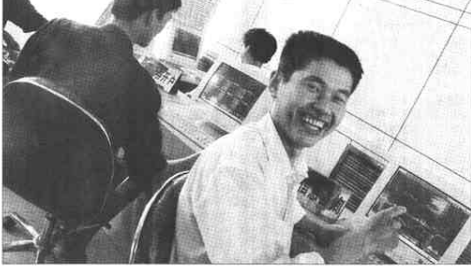
广饶县城区农村信用社，在强化优质服务的同时，采取切实措施，不断加大存储力度。他们主动上门为企业代发工资、代理保险业务。

本报讯 东营区辛店街道主动为客商提供优质服务，提前介入全街道的招商引资工作，打造了适应外商发展的良好“软环境”。