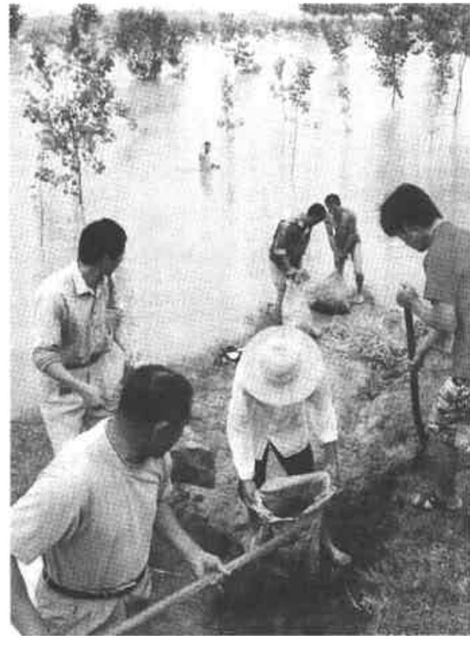
7月9日夜,南京军区某高炮旅战士在江苏盱眙县淮河支流团结河一处险堤下堵漏抢险。当日夜晚,江苏盱眙县淮河支流团结河堤出现管涌险情,南京军区某高炮旅紧急出动250名官兵投入抢险。