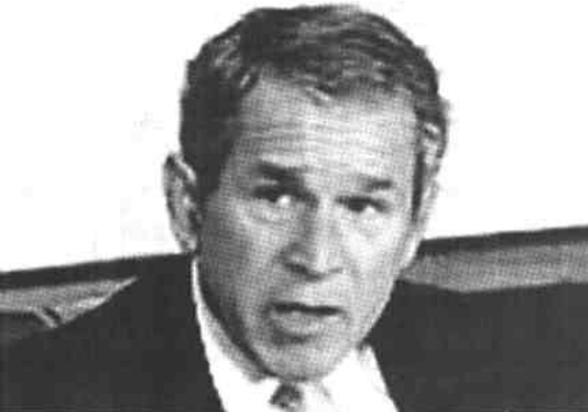
设计台词 掘地三尺 我也要把你找出来。

萨达姆一生经历过数场战争,磨炼了他坚强的性格。波斯特分析称,对萨达姆来说,权力是人生最重要的东西。